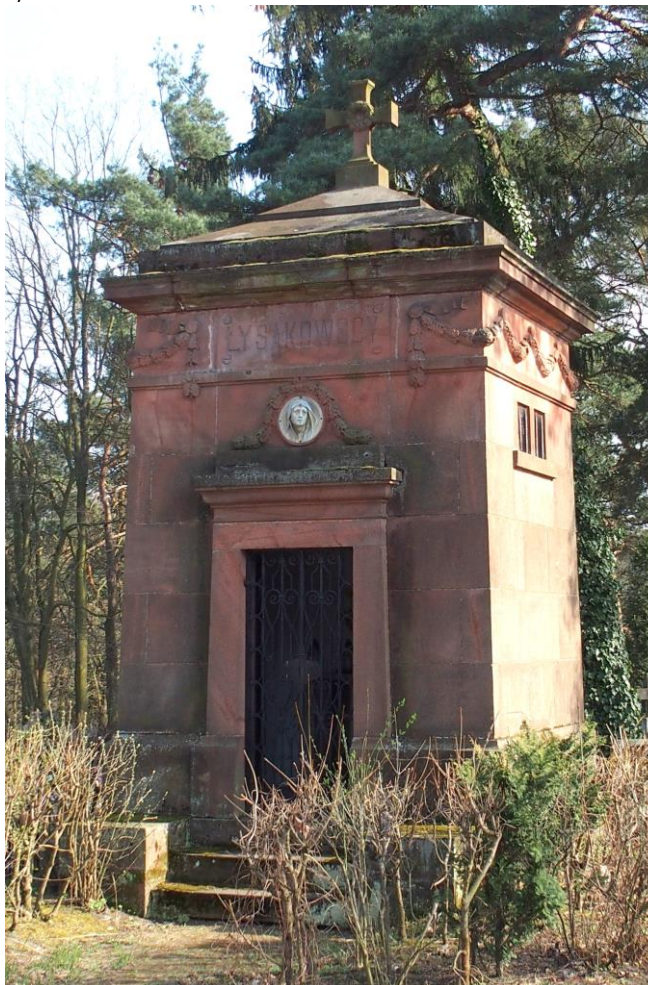
Widok od południowego - zachodu