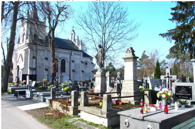
Widok od południowego - wschodu

8. Fotografia z opisem wskazującym orientację albo mapa z zaznaczonym stanowiskiem archeologicznym